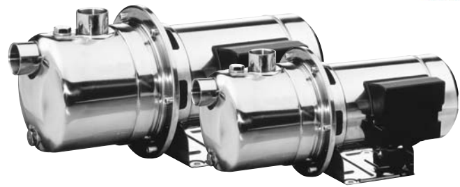
JE Motor encapsulado JES