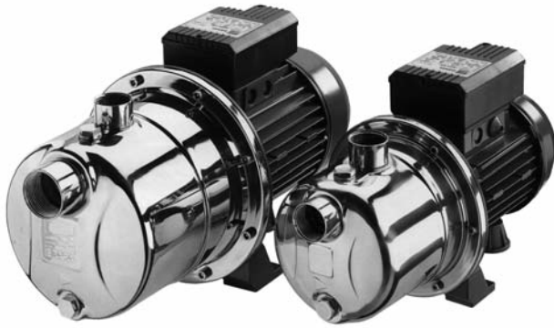
JEX Motor de aletas JESX